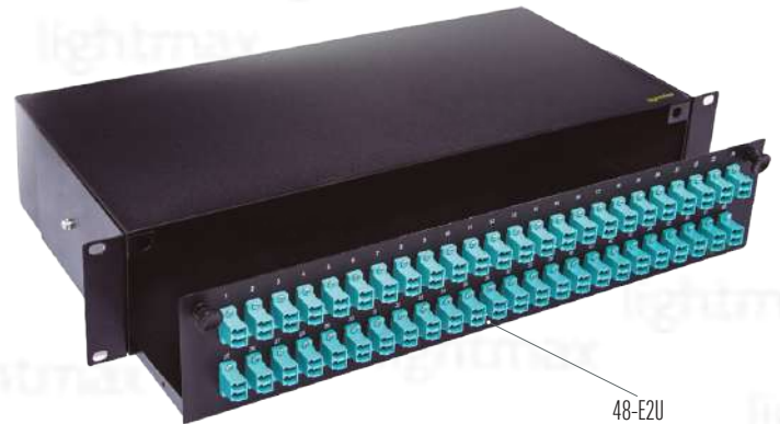
48-E2U [Capacité maximale avec les traversées LC duplex]

[Images uniquement pour des fins de référence]