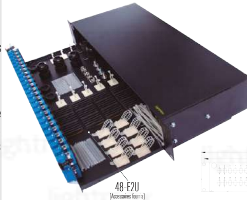
48-E2U (Accessoires fournis)

[Images uniquement pour des fins de référence]