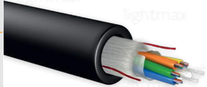
[Imágenes únicamente para fines de referencia]

Cable de tubo holgado dieléctrico LightMax ® para interior / exterior, con elemento central de fuerza en FRP. Los tubos holgados de PBT contienen 12 fibras cada uno y están llenos de un compuesto de relleno adecuado. El cable incluye varillas de plástico como relleno dependiendo de su conteo en fibras. Los tubos holgados se encuentran trenzados alrededor del ECF. Un núcleo seco de elementos hinchables en agua y hilos de fibra de vidrio componen una armadura que agrega protección adicional a la tensión y contra roedores.